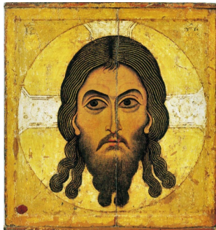
Спас Нерукотворный. XII век. Новгородская школа. Третьяковская галерея.